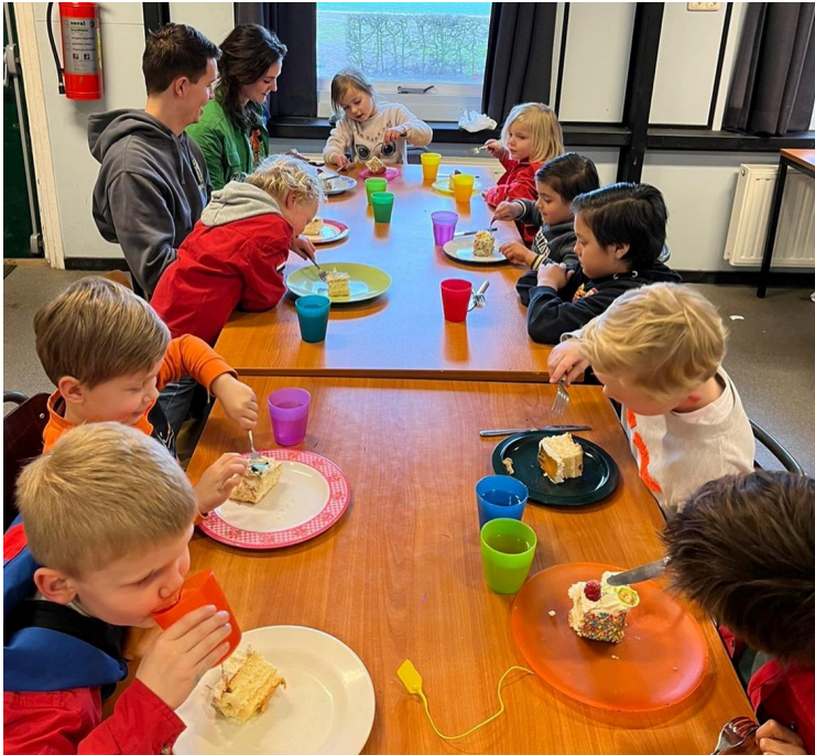
Hoera! 10 bevers, dat betekend taart!! 4 maart 2023